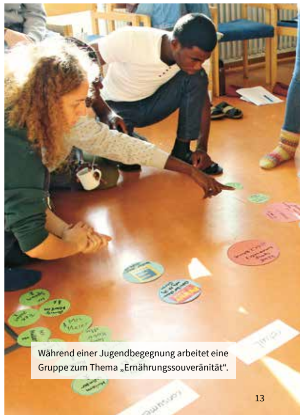
Während einer Jugendbegegnung arbeitet eine Gruppe zum Thema „Ernährungssouveränität“.

Sie finden die beiden Broschüren unter ihrem Titel im Netz. Wenn Sie mehr zu den theoretischen Zusammenhängen zur Klima- und Umweltkrise erfahren möchten, können Sie gern mit der Norddeutschen Mission Kontakt aufnehmen. Wir bieten Vorträge und Workshops zum Thema „Gerechtes Wirtschaften“ und „Gutes Leben für Alle“ an.