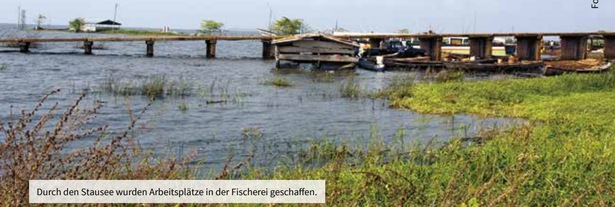
Durch den Stausee wurden Arbeitsplätze in der Fischerei geschaffen.