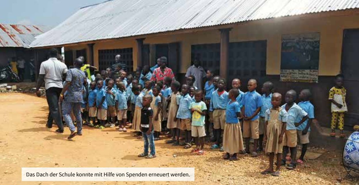
Das Dach der Schule konnte mit Hilfe von Spenden erneuert werden.