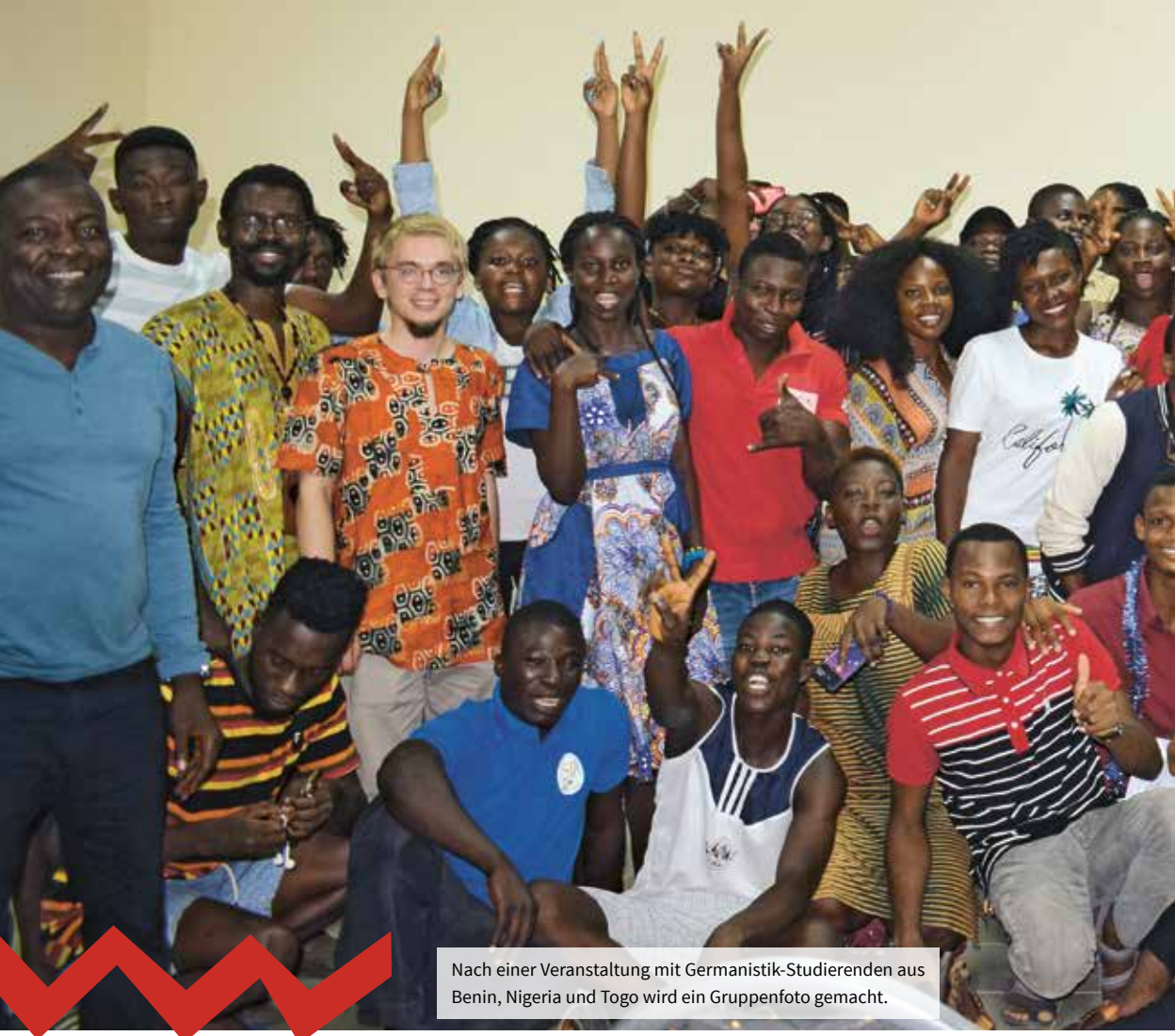
Nach einer Veranstaltung mit Germanistik-Studierenden aus Benin, Nigeria und Togo wird ein Gruppenfoto gemacht.