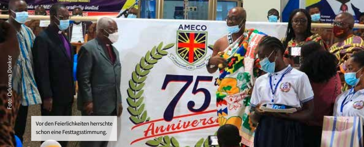
Vor den Feierlichkeiten herrschte schon eine Festtagsstimmung.

nicht zugelassen (erst ab 1950), wurden über tausend. Die Abschlüsse sind heute der Bachelor of Education, was nach Zusatzprüfungen den Zugang zu anderen Hochschulen eröffnet. Zudem hatte das AMECO eine Sektion für Französisch erhalten, die erste Pädagogische Hochschule dieser Art in Ghana; nicht zuletzt um sie auch togoischen Studierenden aus der Schwesterkirche EEPT zugänglich zu machen.