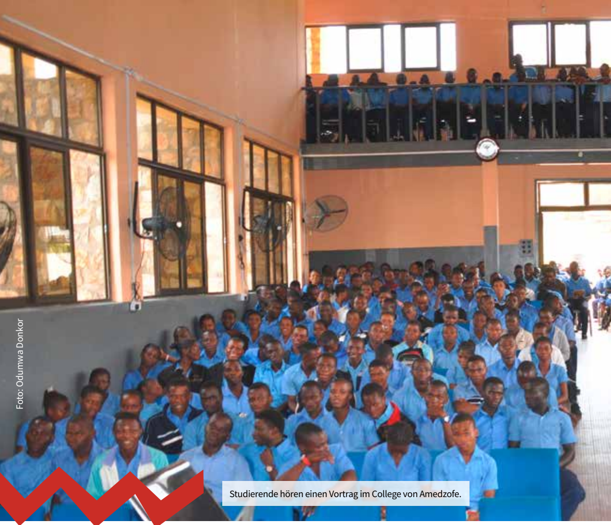
Studierende hören einen Vortrag im College von Amedzofe.