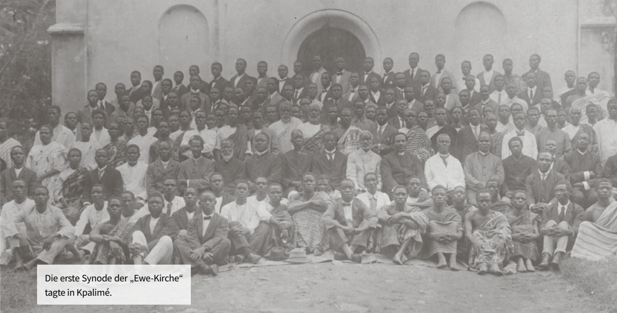
Die erste Synode der „Ewe-Kirche“ tagte in Kpalimé.

Sowohl in geistlicher als auch in gesellschaftlicher Hinsicht stand die Ethnie der Ewe der französischen Kolonialverwaltung entgegen, die aufgrund der Französischen Revolution das „Volk“ als Träger von politischer und Entscheidungsgewalt und Souverän verstand. Die Träger der Ewe-Kirche widerstanden einer Ein- und Unterordnung.